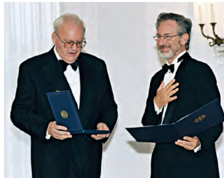
Bundespräsident Roman Herzog überreicht dem amerikanischen Filmregisseur Steven Spielberg für den Film „Schindlers Liste“ das Große Verdienstkreuz mit Stern des Verdienstordens der Bundesrepublik Deutschland am 10. September 1998

Bei Verleihungen im Ausland wird die Aushändigung des Verdienstordens zumeist von den deutschen Botschaftern, die die Vertreter des Bundespräsidenten im jeweiligen Staat sind, vorgenommen.